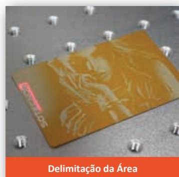
Delimitação da Área