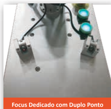
Focus Dedicado com Duplo Ponto