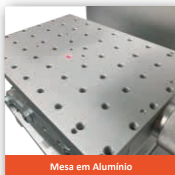
Mesa em Alumínio