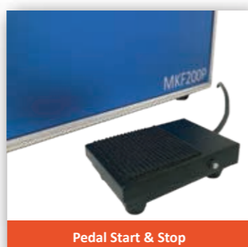
Pedal Start & Stop