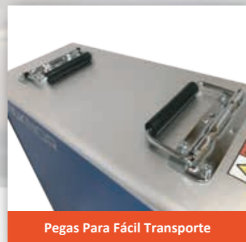
Pegas Para Fácil Transporte