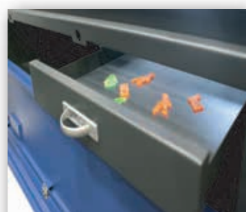
Mesa Elevatória com Gaveta