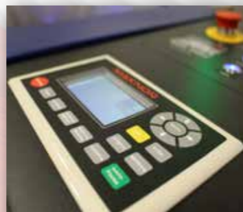
Painel de Comando