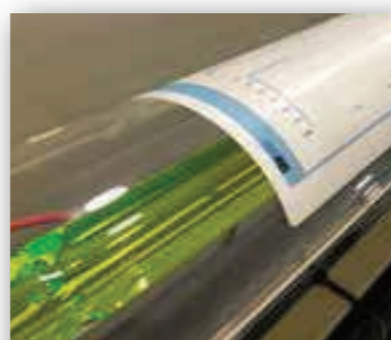
Tubo Laser CO2