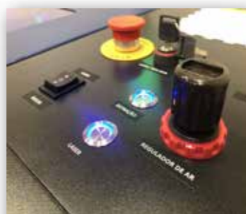
Regulador Fluxo de Ar