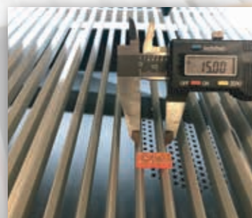
Lâminas Removíveis Espaçadas 15mm