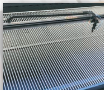
Lâminas Removíveis Espaçadas 15mm