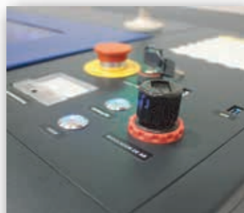
Regulador Fluxo de Ar