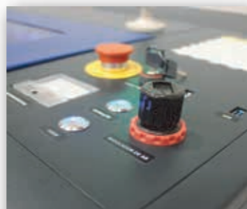
Regulador Fluxo de Ar