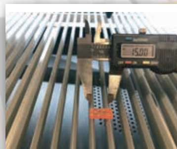
Lâminas Removíveis Espaçadas 15mm