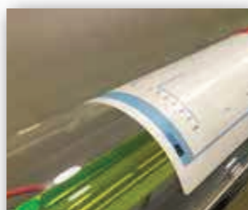
Tubo Laser CO2