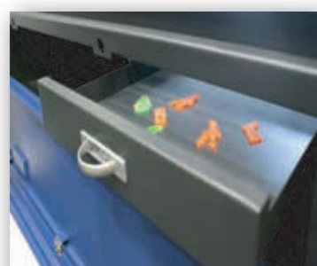
Mesa Elevatória com Gaveta